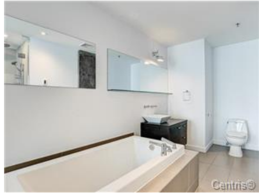
Salle de bains attenante à la CCP