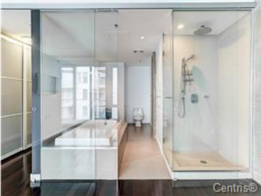
Salle de bains attenante à la CCP