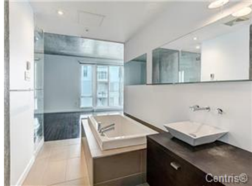
Salle de bains attenante à la CCP