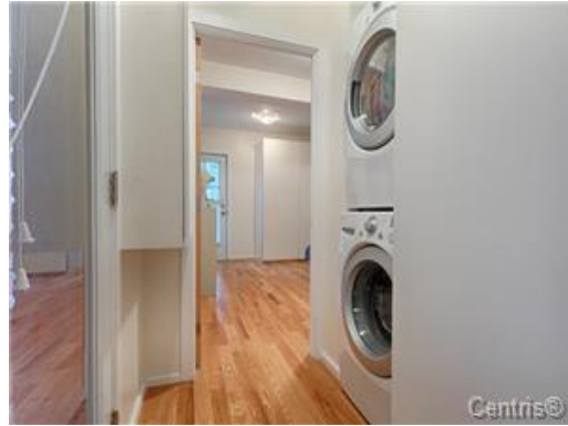
Salle de lavage