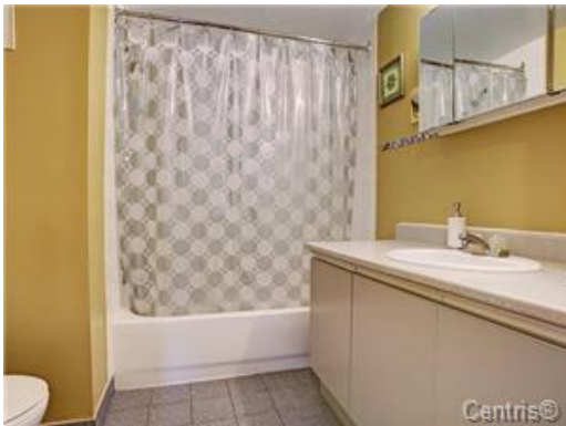
Salle de bains