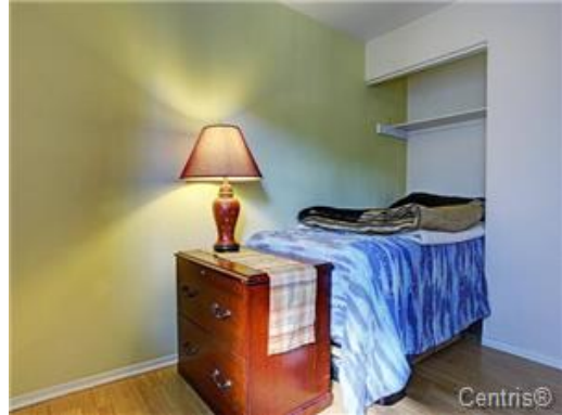
Chambre à coucher