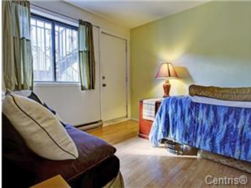
Chambre à coucher