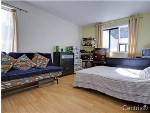
Chambre à coucher