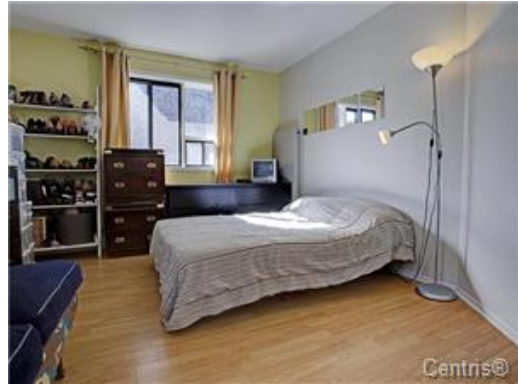
Chambre à coucher